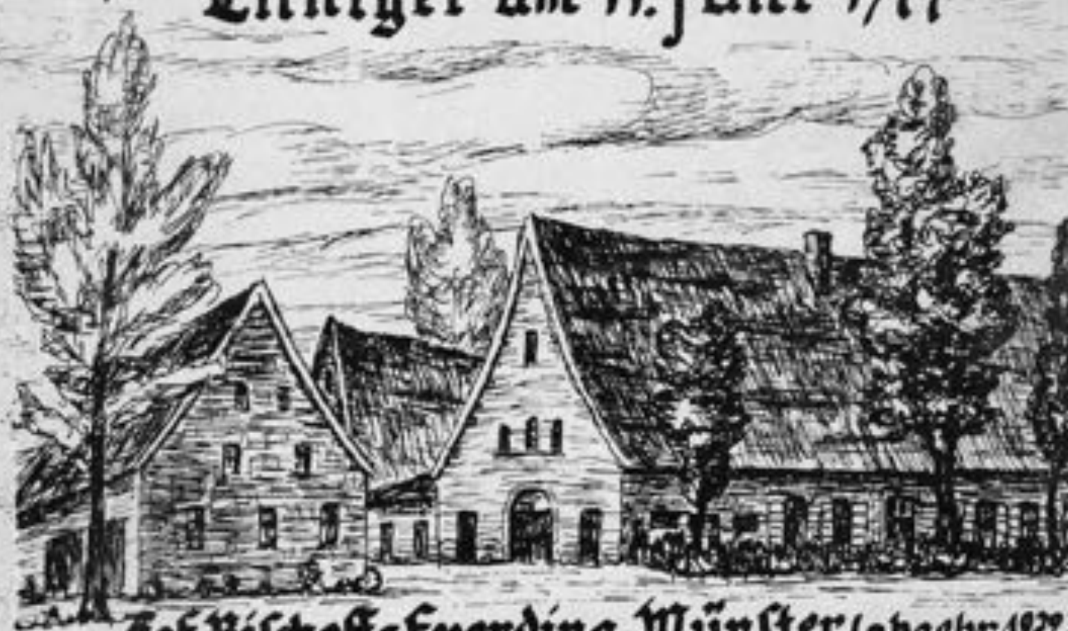
Hof Bischoff-Everding, Münster (abgebr. 1972)