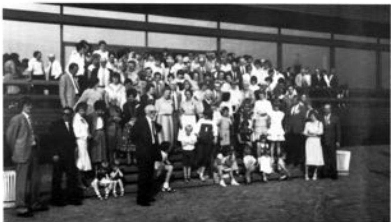
Nach dem Kaffeetrinken vor der Mensa, Nordkirchen, - etwa 100 von insgesamt 402 Festteilnehmern -